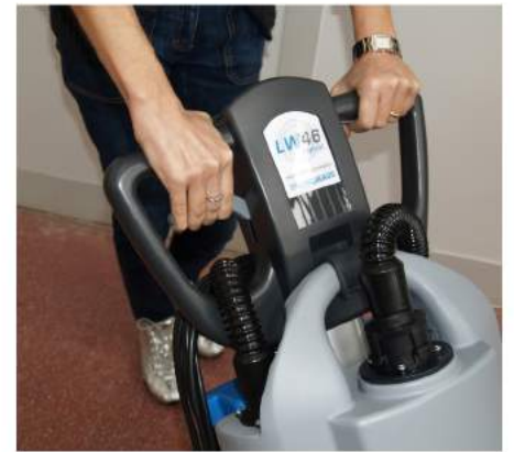
5. Tryck in spaken och vrid handtaget nedåt till en bekväm arbetsposition.