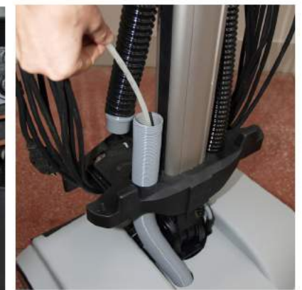
9. Om igensättningen är belägen i den övre delen av slangarna kopplar du loss de två slangarna för vidare kontroll. Kontrollera även den svarta slangens övre böj.