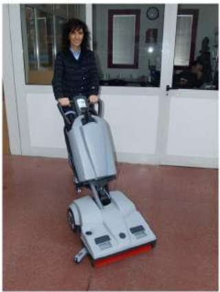
8. Tryck in de två spakarna på handtaget och börja röra dig framåt.

LADDA ALLTID BATTERIET EFTER ANVÄNDNING.