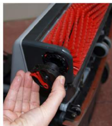
7. Sylinteriharjan lukituksen avaaminen: Aseta kone selälleen. Käännä koneen oikeassa reunassa olevaa harjan lukitsinta ja työnnä sylinteriharjalla lukitsin ulospäin. Vedä lukitsin pois. Irrota harja kääntämällä sitä koneesta pois päin ja vetämällä. Harja kiinnitetään paikalleen toistamalla työvaiheet toisinpäin.