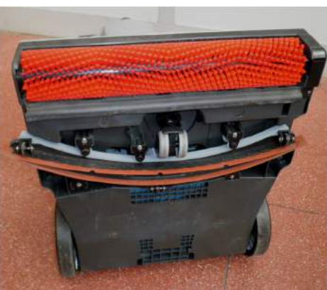
6. När du har tagit bort båda vattentankarna lägger du ned maskinen med baksidan mot golvet och rengör borstområdet, cylinderborstens gummiskrapa, sugmunstycket och kombimaskins base med en svamp.