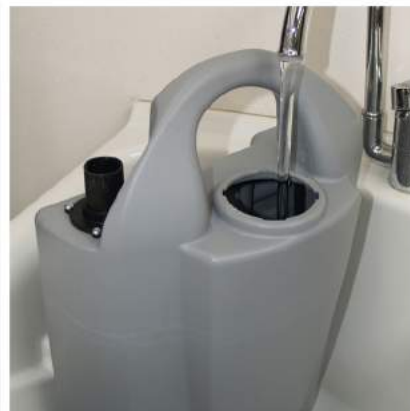
3. Tvätta slasktanken efter användning för att undvika att dålig lukt eller bakterier uppstår.