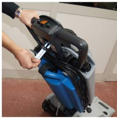
3. Laske harja ja imusuulake alas puhdasvesisäiliön yllä olevasta metallisesta vivusta.