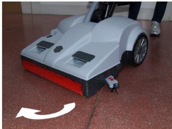
9. Kun käännyt, imusuulake kääntyy vastakkaiseen suuntaan imeäkseen kunnolla kaiken veden.