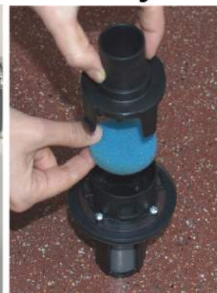
4. Kontrollera filtret efter användning. Om det är smutsigt ska du skölja det, pressa ur vattnet så filtret blir torrt och sätta tillbaka det.