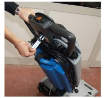
10. Työskentelyn jälkeen nosta sylinteriharja ja imusuulake ylös.