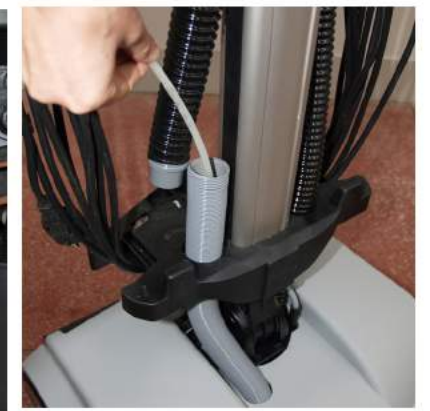
9. Jos tukos on letkun yläosassa, irrota kummatkin letkut ja tarkista ne. Tarkista myös mustan letkun ylämutka. Puhdista letkut tarvittaessa imuletkun puhdistusharjalla.