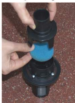
4. Tarkasta ylitäyttösuojan suodatin aina käytön jälkeen. Mikäli suodatin on likainen: pese se, purista kuivaksi ja asenna takaisin paikalleen.