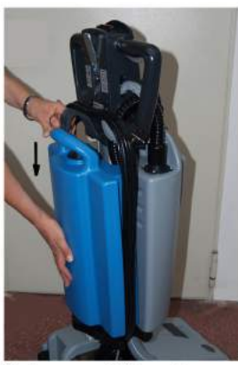
2. Asenna säiliö pystysuoraan paikoilleen ja lukitse säiliö.