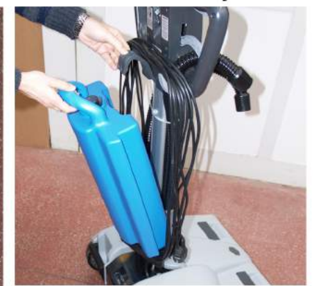
5. Irrota ja tyhjennä puhdasvesisäiliö.