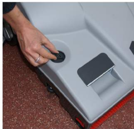
4. Valitse harja ja imusuulake lattiain materiaalin mukaan. Säädä harjapaine lattiain tyyppiin ja työskentelynopeuden mukaan.