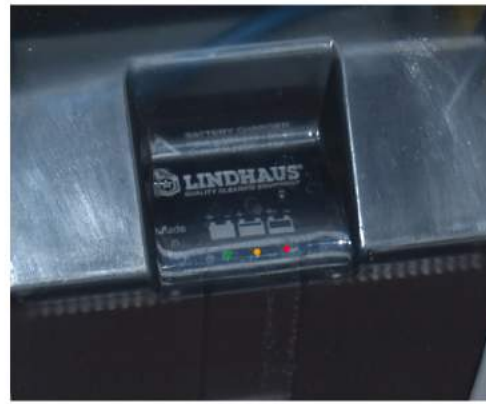
7. Kontrollera batteriets laddningsnivå: A. Grön: laddat, du kan arbeta med maskinen. B. Orange: snart urladdat, ladda maskinen eller anslut sladden. C. Röd: urladdat, avbryt arbetet och ladda maskinen.

LADDA ALLTID BATTERIET EFTER ANVÄNDNING.