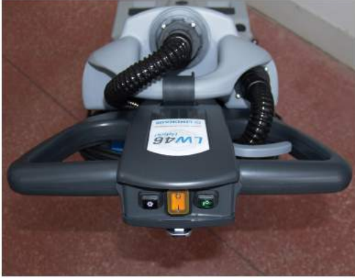
6. Tryck på knapparna: den orange är strömbrytaren, den till vänster är för sugning och den till höger för vattenpumpen.