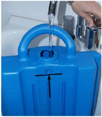
1. Täytä puhdasvesisäiliö ja annostelee puhdistusaine puhdasvesisäiliöön annosteluohjeen mukaisesti.