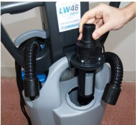
1. Ta bort de två slangarna, lossa filter-/flottörsystemets lock, lyft upp kroken och ta ur tanken.