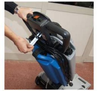
10. Höj alltid upp spaken efter avslutat arbete.