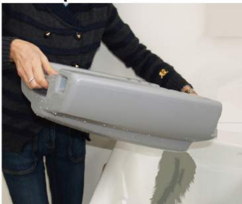
2. Töm tanken i avloppet.