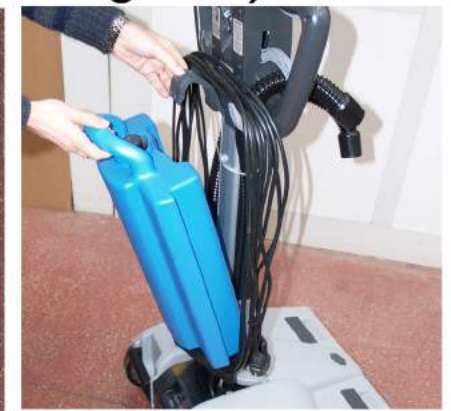
5. Ta bort och töm tanken med rent vatten för att undvika att vatten eventuellt rinner ur och skadar golvet.